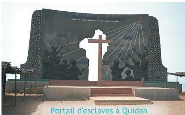
Portail d'esclaves à Quidah